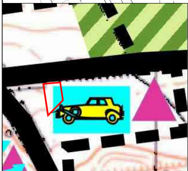
— granica opracowania Wyrys ze studium uwarunkowań i kierunków zagospodarowania przestrzennego gminy Kamiennik Nr III / 10 / 06 z dnia 13 grudnia 2006 r.