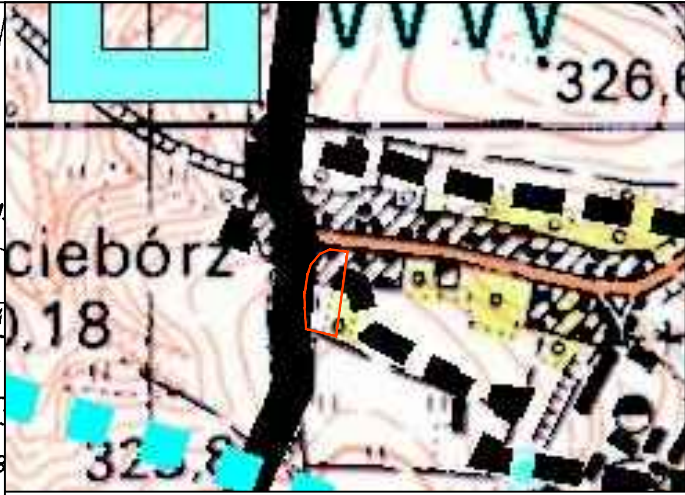
WYRYS ZE STUDYUM UWARUNKOWAŃ I KIERUNKÓW ZAGOSPODAROWANIA PRZESTRZENNEGO GMINY KAMIENNIK

zatwierdzonego uchwałą Rady Gminy Nr III/10/06 z dnia 13 grudnia 2006r.